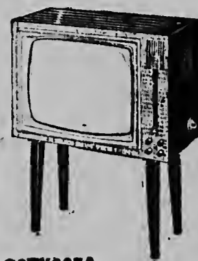
23TX367A Asymmetrisch apparaat met 50 cm beeldbuis. Exclusieve Philips feature: garanderen rotsvast beeld: DUBBELE automatische synchronisatie, automatische beeldhoogte- en beeldbreedte-instelling, an MemoMatic Fijnafstemming, Additioneel feature: Rapidivision druktoets brengt beeld terug tot normale secundaire...